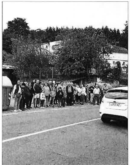
Los vecinos, ayer, concentrados en un tramo sin aceras.

A mayores exigen mejoras en las aceras, cuyo estado obliga muchas veces a bajar al asfalto para caminar. Alertan de la inseguridad en la parada del autobús escolar y reclaman mejoras en los cruces con la FO-313, que obligan a los conductores a invadir los dos carriles para incorporarse. Los residentes en Broullón temen atropellos y se quejan de que “parece que los vecinos de este barrio no tenemos derecho a pasear”.