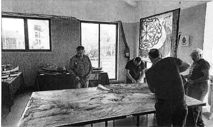
Arriba: la organización de la exposición. Decha.: representantes de Devanceiros y del Concello.

En la exposición “única”, por ser la primera dedicada exclusivamente a los naufragios, se podrán ver las noticias de prensa de los distintos sucesos que sacudieron la vida de una villa marinera como Moaña, así como las fotografías recuperadas con la colaboración de las familias y de la Agrupación Cultural Nós. “Son imágenes tratadas con respeto,