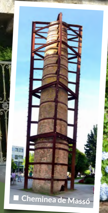
■ Cheminea de Massó

A nivel etnográfico destaca la Ruta dos Muíños, recorrido que siguiendo el río Bísopo permite visitar la iglesia parroquial de San Martiño así como una fuente del siglo XVIII, un lavadero y varios molinos fluviales que reflejan el fuerte vínculo que ligaba a los agricultores al agua para la molienda del cereal. En el final llegamos a los molinos de Canudo y da Presa, los únicos restaurados y funcionales del recorrido y de visita obligada cuando se muele el millo corvo. En cuanto a la arquitectura civil, la ruta de los Pazos se centra en estas viviendas señoriales de carácter rural, de gran importancia en la época moderna, que funcionaban como elementos centrales de administración del territorio y alrededor de los cuales se desarrollaba la vida de los aldeanos. Los Pazos de Santa Cruz, de Castrelo, Ouril y la Casa de los Picos, sin desmerecer la capilla de los Santos Reis, son ejemplo de esta arquitectura de plantas sencillas y próxima a las tierras fértiles, en colinas que permiten al señor un amplio control de sus propiedades. La Ruta dos Abades, en cambio, recorre parte de los templos más singulares del municipio como la iglesia románica de Santa María de Cela, la más representativa de este estilo dentro del concello y sobre todo