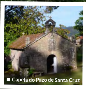
■ Capela do Pazo de Santa Cruz