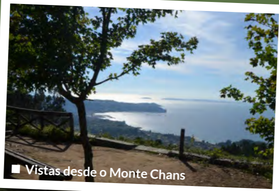
■ Vistas desde o Monte Chans