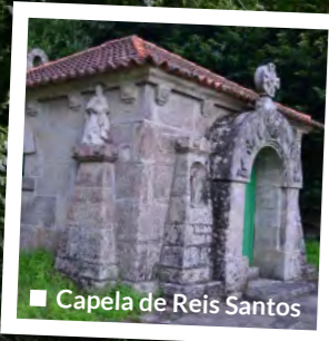
■ Capela de Reis Santos