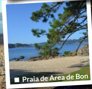
■ Praia de Area de Bon