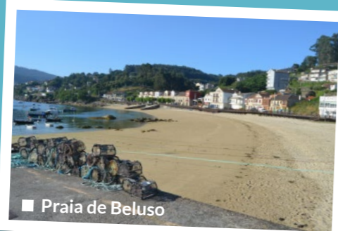
■ Praia de Beluso