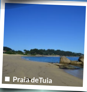
■ Praia de Tuia