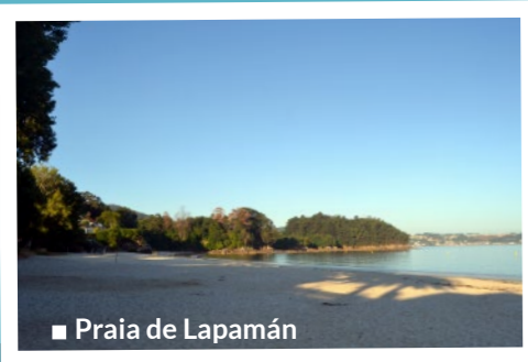
■ Praia de Lapamán