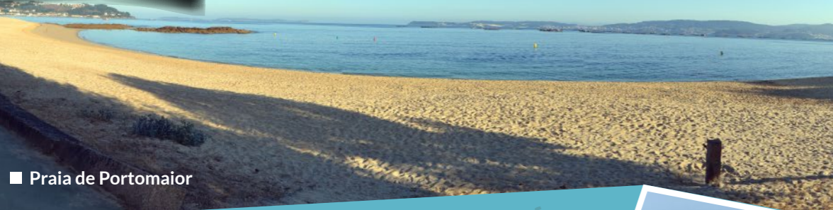
■ Praia de Portomaior

Asimismo, la isla de Ons es un enclave paisajístico de muy recomendable visita dentro del Parque Nacional de las Islas Atlánticas. Presenta un marcado contraste entre la mitad oeste, con furnas y cuevas marinas, y la mitad este más reposada. Y entre sus arenales destacan la playa de Melide, algo lejana pero considerada la más hermosa y de reconocido uso naturista; la playa de Arena dos Cans, la más visitada por su fácil acceso y donde la bajamar descubre la Laxe do Crego, sepultura antropomorfa excavada en la roca; y la playa de Canexol, en la que se esconden restos de factorías de salazón romanas.