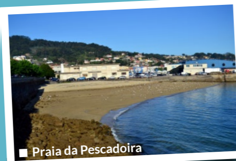
■ Praia da Pescadoira