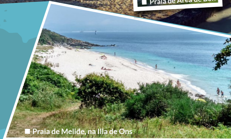
■ Praia de Melide, na Illa de Ons

Asimismo, la isla de Ons es un enclave paisajístico de muy recomendable visita dentro del Parque Nacional de las Islas Atlánticas. Presenta un marcado contraste entre la mitad oeste, con furnas y cuevas marinas, y la mitad este más reposada. Y entre sus arenales destacan la playa de Melide, algo lejana pero considerada la más hermosa y de reconocido uso naturista; la playa de Arena dos Cans, la más visitada por su fácil acceso y donde la bajamar descubre la Laxe do Crego, sepultura antropomorfa excavada en la roca; y la playa de Canexol, en la que se esconden restos de factorías de salazón romanas.