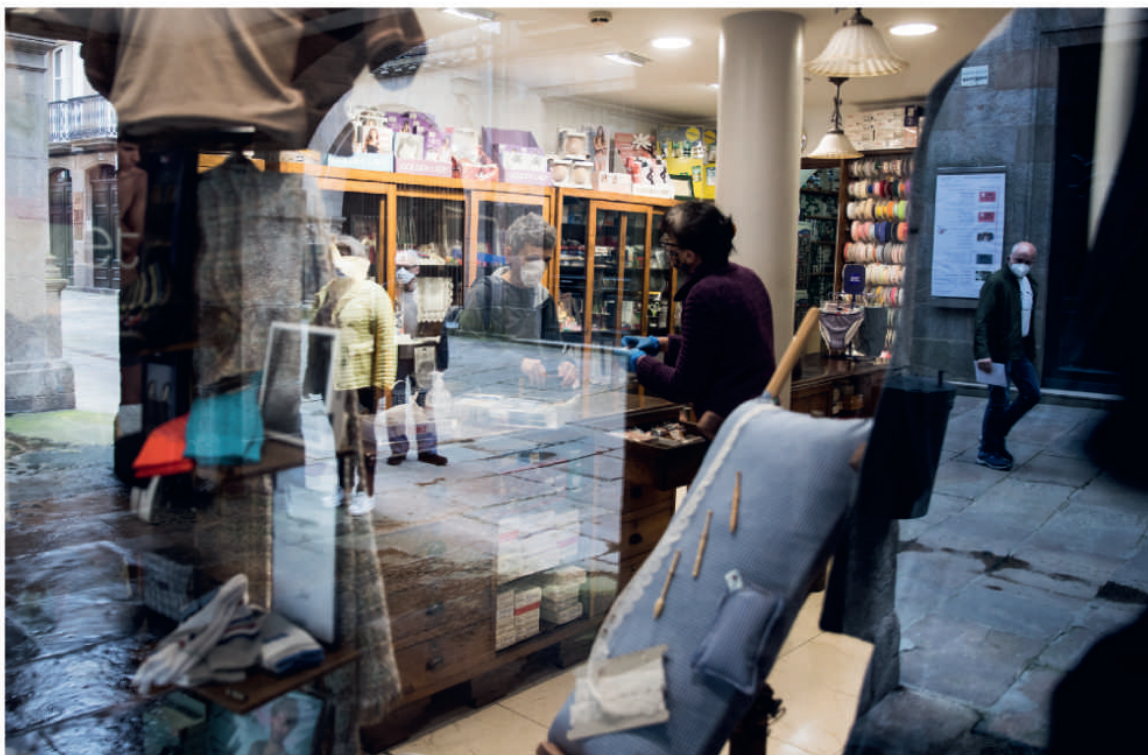
Unha pequena mercería de Santiago de Compostela atende os seus clientes con cita previa no primeiro día de apertura para pequenos comercios.

resultou «un engano colectivo; a ilusión dunha vida mellor... a idea de que regresar á casa petrual era volver para atrás; aquilo era do que había que fuxir». Para que nos sacrificamos? Para que emigramos? Para que estudas? Para volverdes á aldea?