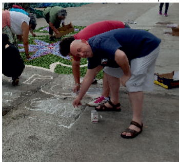
E como alfombrista