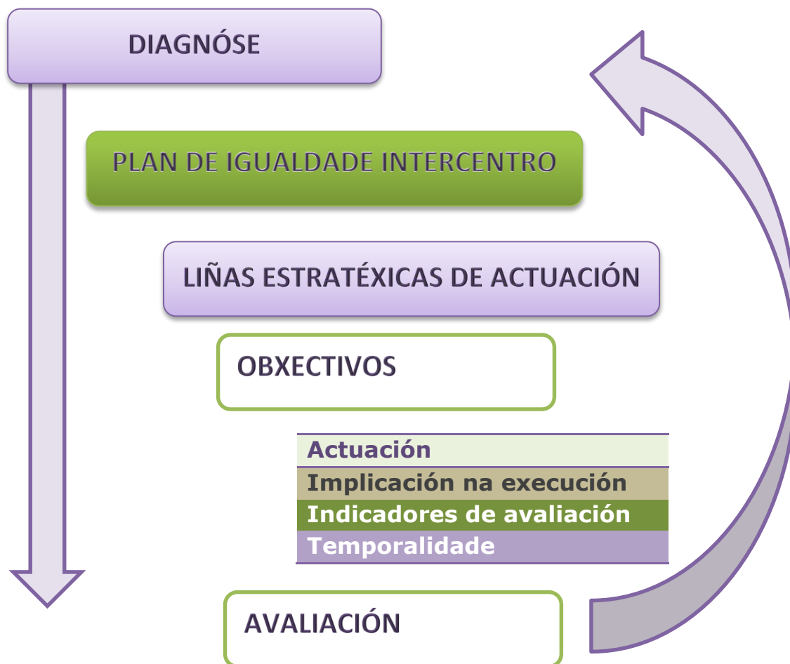
Figura 3: Estrutura do Plan