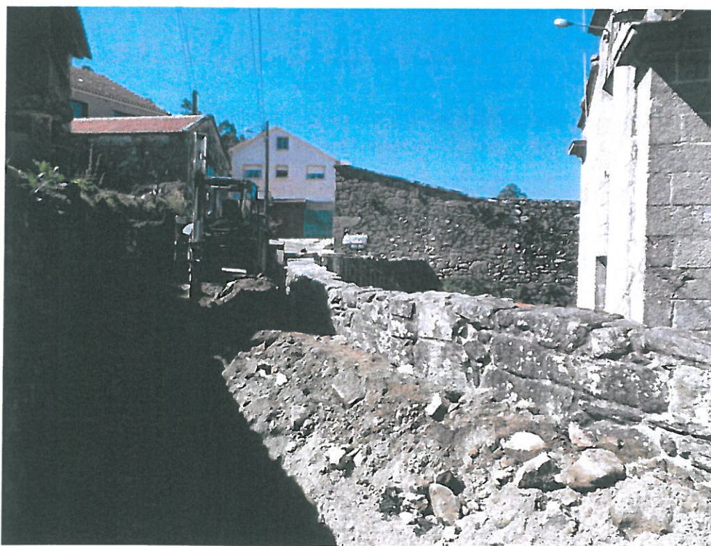
Obras de dotación da rede de saneamento no lugar, baixo control arqueolóxico.

Á luz dos resultados das catas arqueolóxicas e a identificación dun nivel de terra negra con tellas antigas, no entorno da praza, poderase ampliar as cotas da obra nesa zona, co fin de delimitar ese nivel o máximo posible se a dirección de obra o acepta.