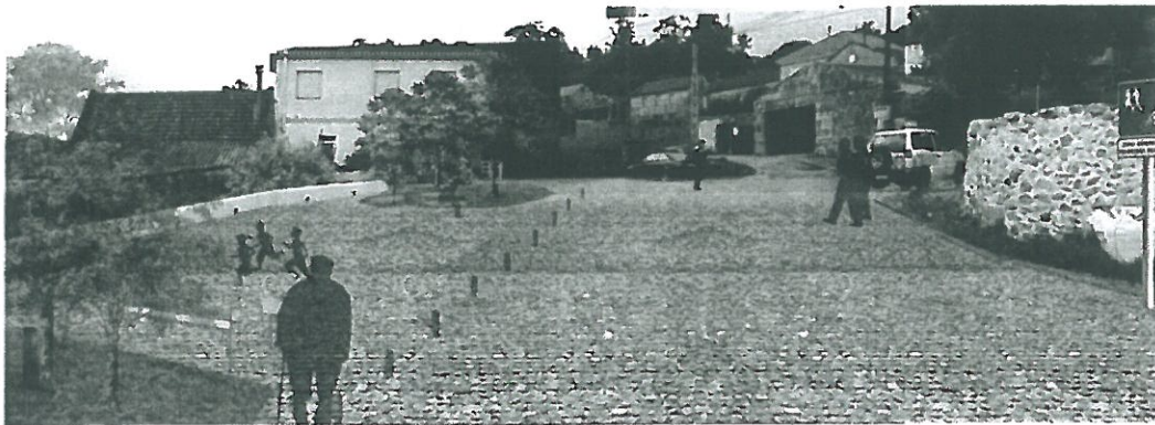
Imaxe: Anteprojecto de rexeneración do entorno da igrexa de Ermelo. Alfredo de la Campa Ferverza.